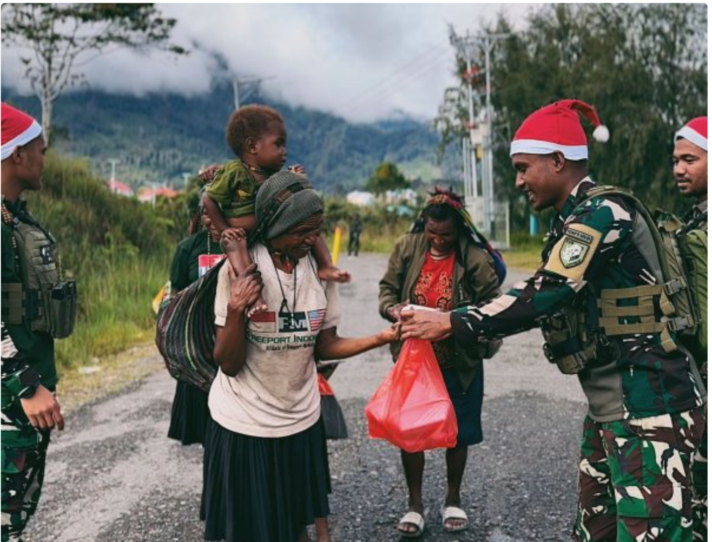
Foto: Satgas Yonif 509 Kostrad memberikan makna baru pada patroli keamanan dengan berbagi kebahagiaan bersama masyarakat di Intan Jaya, Papua.

PAPUA- Dalam balutan semangat Natal yang damai, Satgas Yonif 509 Kostrad memberikan makna baru pada patroli keamanan dengan berbagi kebahagiaan