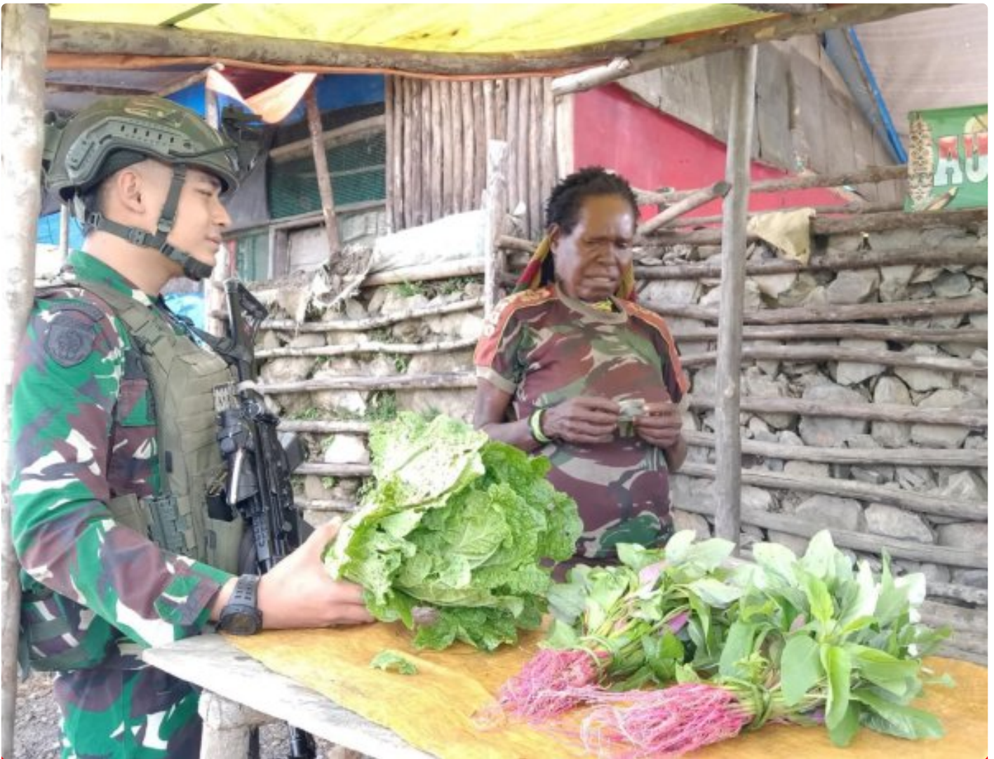
Prajurit TK Pintu Jawa Satgas Mobile Yonif 323/Buaya Putih Memborong hasil Tani mama Papua yang dijual di TK Pintu Jawa

Satgas Pamtas Mobile Yonif 323 Buaya Putih Kostrad TK Pintu Jawa melaksanakan kegiatan ROSITA, kegiatan ini bertujuan untuk membeli hasil tani dari Mama-mama Papua yang datang ke TK Pintu Jawa sebagai wujud saling membutuhkan dan mendukung perekonomian warga setempat, yang