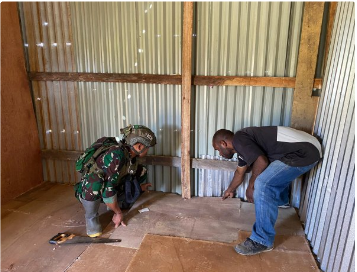
Satgas Yonif 323 Buaya Putih Titik Kuat Kodim Persiapan Membantu Masyarakat membangun Warung

Satgas Yonif 323 Buaya Putih Kostrad yang bertugas di wilayah pedalaman Papua kembali menunjukkan komitmennya dalam membantu masyarakat setempat, Kali ini, Satgas Yonif 323 Buaya Putih Kostrad Titik Kuat Kodim